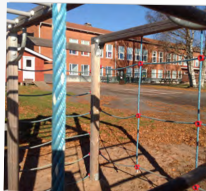
LEK OCH GLÄDJE